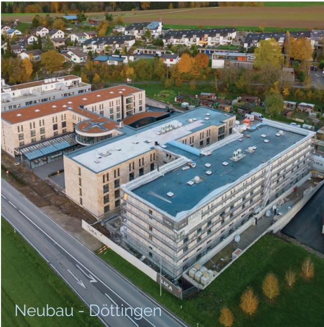
Neubau - Döttingen