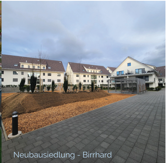
Neubausiedlung - Birrhard