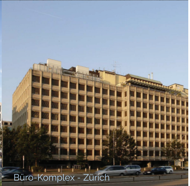
Büro-Komplex - Zürich