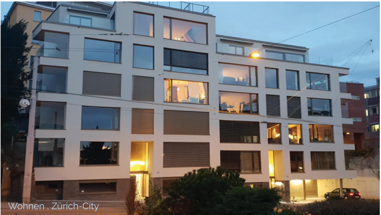
Wohnen , Zürich-City

<<ausgewählte Mandate: verkauft - vermietet>>