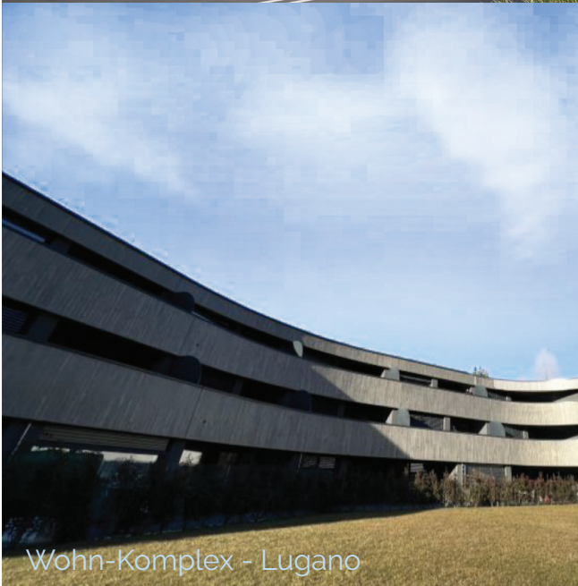
Wohn-Komplex - Lugano