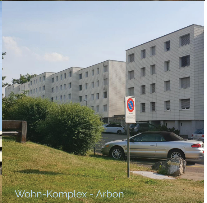
Wohn-Komplex - Arbon