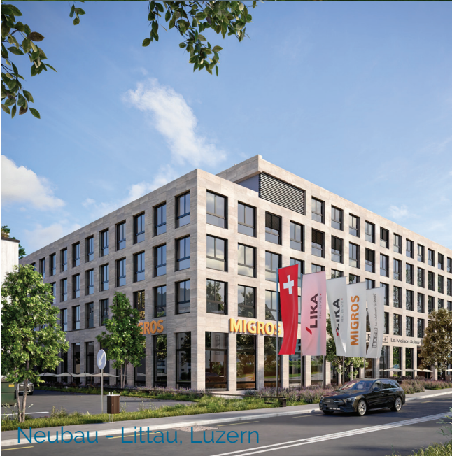
Neubau - Littau, Luzern